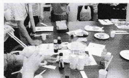
全職員で試食しながら選んでいます。秋をお楽しみに