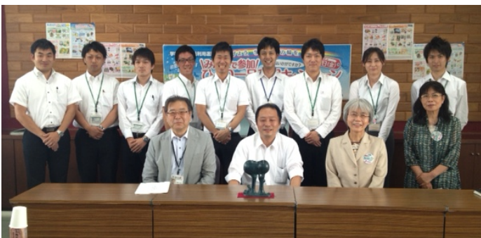
進発式 学校生協会館にて 6月17日(月)

6月18日～7月19日にかけて明治安田生命が、 学校を訪問し保険の説明をしております。 お気軽にご相談下さい。